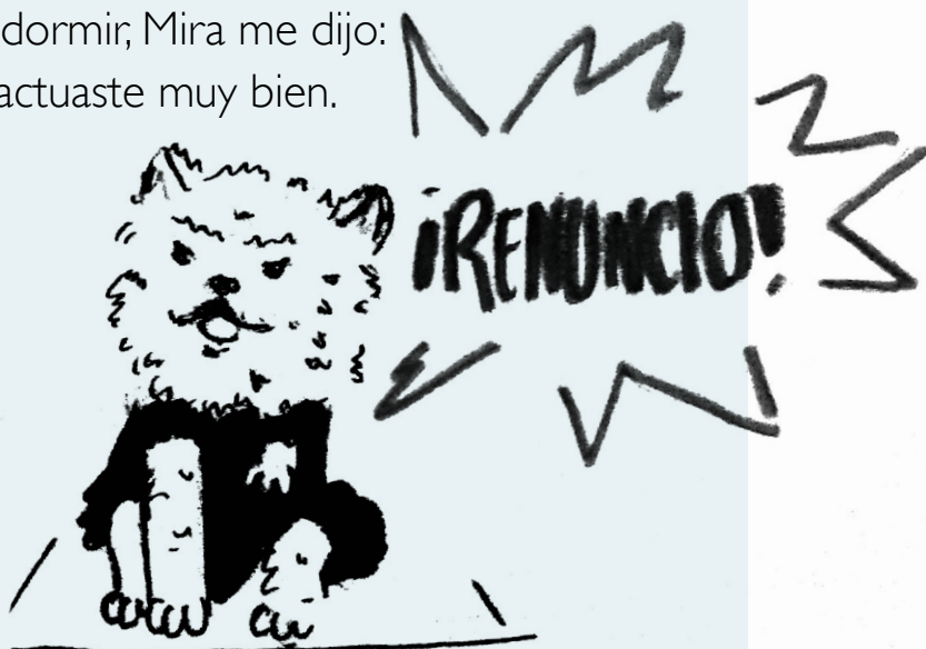
Ilustración: Cecilia Monserrat Jarquin Pérez

Mira nos llevó al pulgoso y a mí a jugar al parque; nos lanzaba pelotas y nosotros corríamos por ellas y se las traíamos de regreso. En la noche nos dio de cenar croquetas. Travis se quedó profundamente dormido junto a Santiago. La verdad, me dio ternura, ya le iba agarrando cariño a mi nuevo hermano Travis... pero no se lo digan, ¡no se lo vaya a creer! Una vez que estaba lista para dormir, Mira me dijo: —Buenas noches Pelusa, hoy actuaste muy bien.