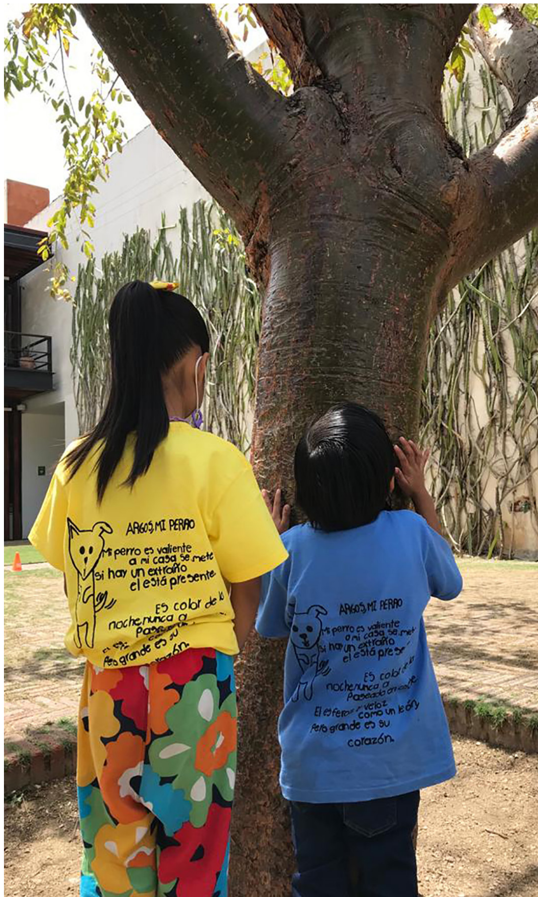
ARGOS, MI PERRO